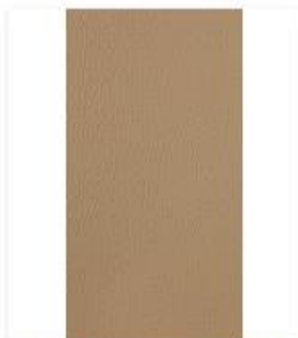
Broadway Khaki Swatch