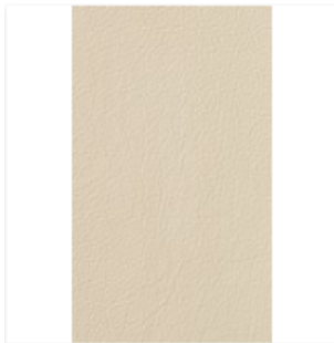
Broadway Alabaster Swatch