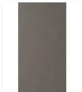
Broadway Granite Swatch