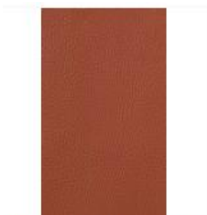
Broadway Spice Swatch