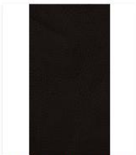
Broadway Onyx Swatch