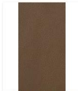
Broadway Mink Swatch