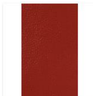
Broadway Crimson Swatch