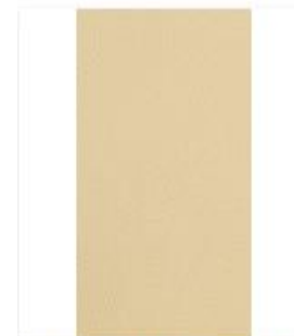
Broadway Bone Swatch