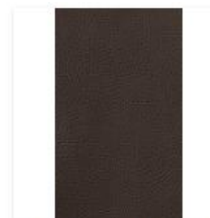
Broadway Java Swatch