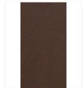
Broadway Toffee Swatch